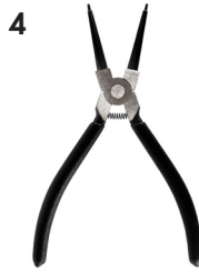
Kuva 3. Hiukkassuodatin avattuna. Jousirengas irrotetaan jousirengaspihdeillä.