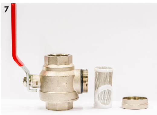
Kuva 6. Hiukkassuodatin, jossa ei ole jousirengasta.